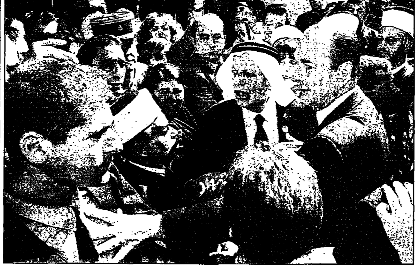
الرئيس الفرنسي جاك شيراك يبيع جنوداً إسرائيليين أثناء زيارته للقدس الشرقية في تشرين الأول (أكتوبر) للناضي (روبرت)

روس الأخيرة لكل من عرفات وبن نتانياهو وخلفها. لقد أحبط واشطن ياسلوف هزل الأسس التي جعلها لها العرب واليهود في عملية عام 1991. ولم يحرق العلم الأمريكي في شوارع الإمارات الخليفية كما فعلت إيران علاقاتها مع منظمة التحرير الفلسطينية بعد 18 عاماً من العلاقات الباردة. وقد التقى الرئيس الفلسطيني ياسر عرفات في اسلام اباد. وفي نفس الوقت أعلنت ام المتحدة الفلسطيني الذي نشأ هجوم لا ابيد ان ابنا مات بشرفه.